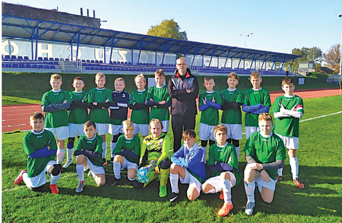
Młodzicy pokonali rówieśników z Przybyszowa.