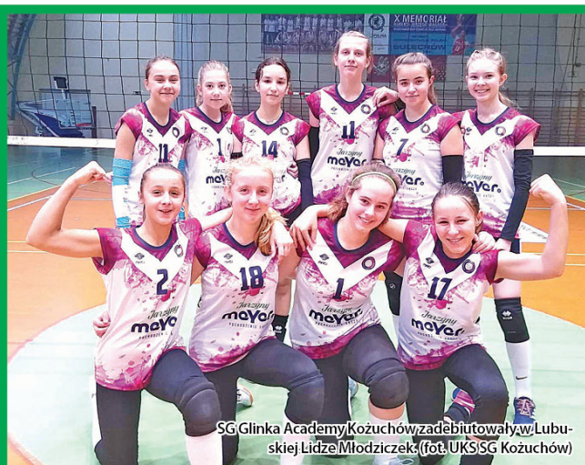
SG Glinka Academy Kozuchów zadebiutowały w Lubuskiej Lidze Młodziczek