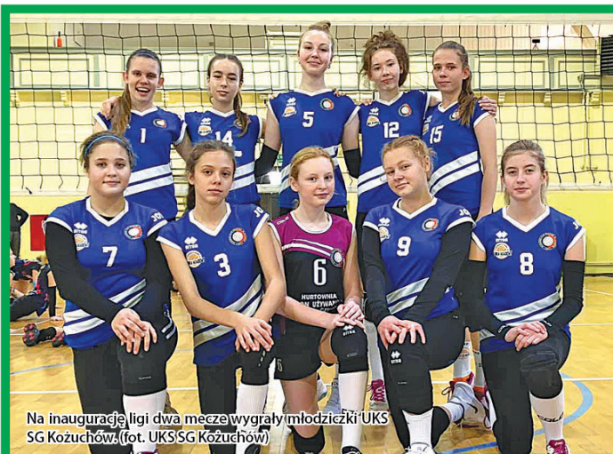
Na inaugurację ligi dwa mecze wygrały młodziczki UKS SG Kozuchów