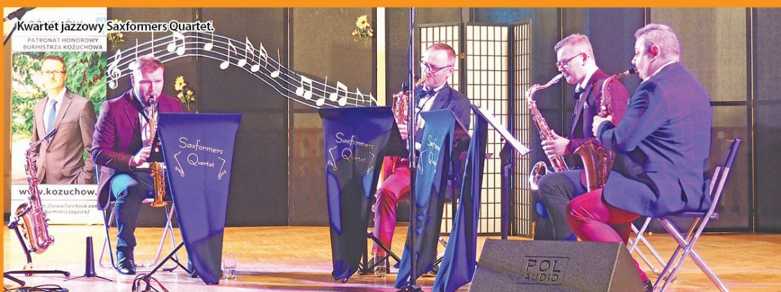
Kwartet jazzowy Saxformers Quartet.