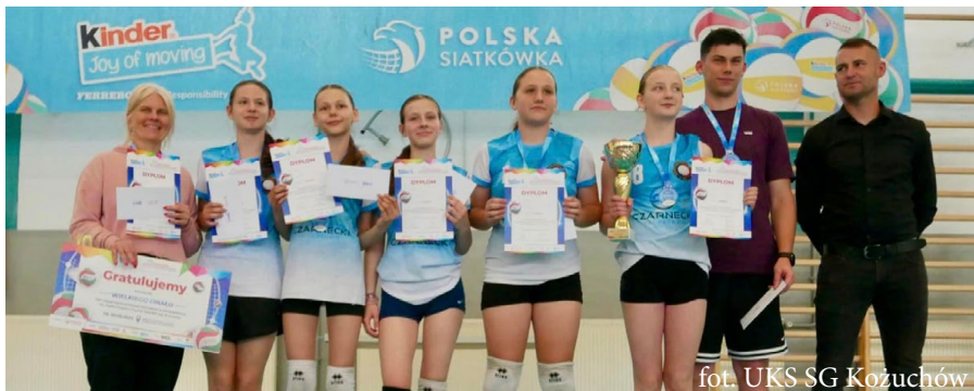
fol. UKS SG Kożuchów